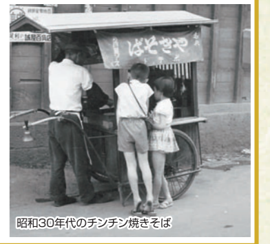
昭和30年代のチンチン焼きそば

着した。戦後、ジャガイモに麵が入るようになり「ポテト入り焼きそば」が誕生。当時、屋台の焼きそばは「チンチン焼きそば」と呼ばれ、三角形に折った新聞紙に焼きそばを入れて渡してくれたことは、足利の懐かしい記憶となっている。